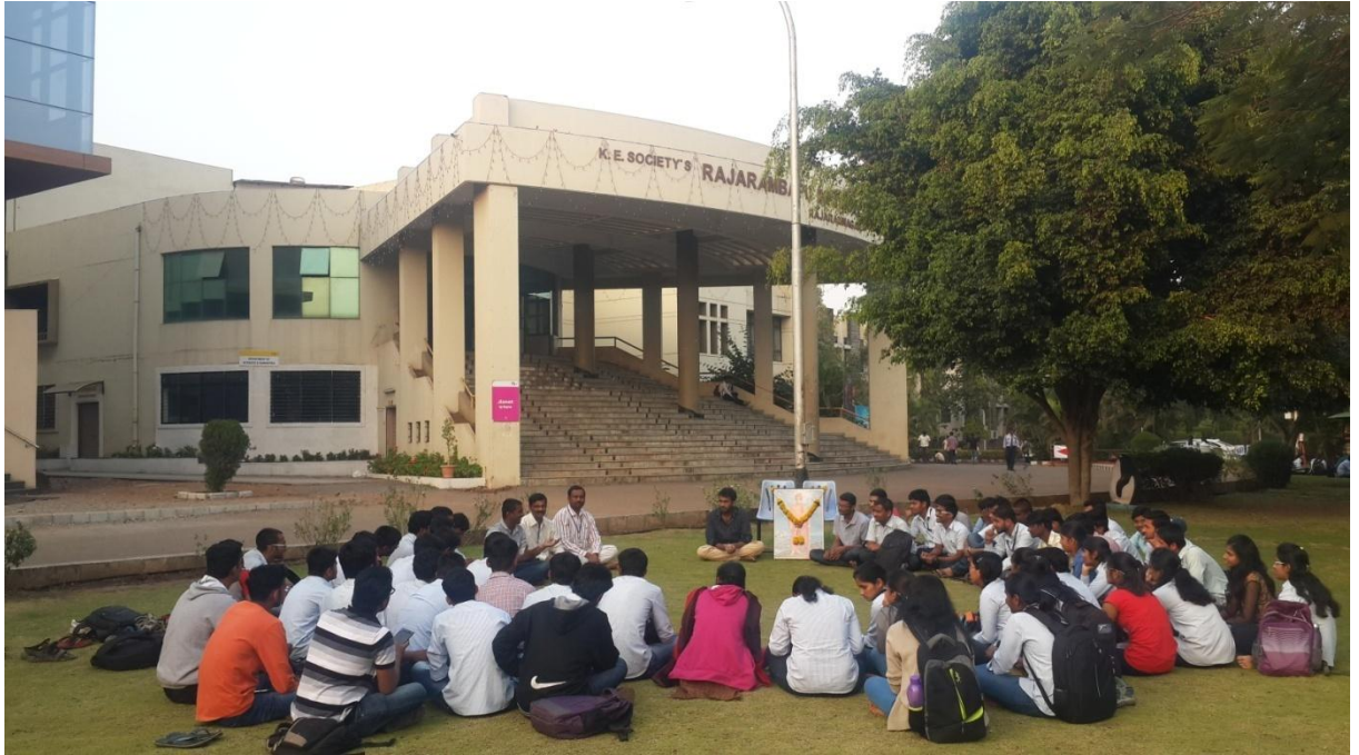
'राष्ट्रीय युवा दिन' निमित्त आयोजित चर्चासत्र