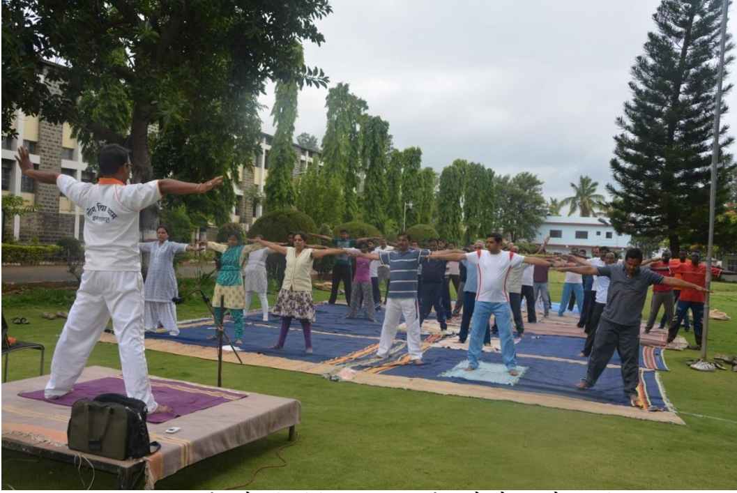
दिनांक २१ जून २०१६ दुसरा आंतरराष्ट्रीय योग दिनानिमित्त आर.आय.टी. मध्ये योगासनांचे प्रात्यक्षिक सादर करताना उपस्थित उपस्थित शिक्षक व विद्यार्थी