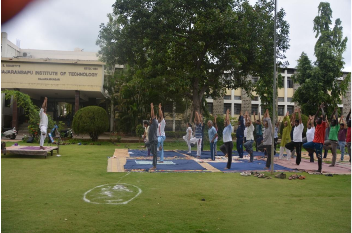
दिनांक २१ जून २०१६ दुसरा आंतरराष्ट्रीय योग दिनानिमित्त आर.आय.टी. मध्ये योगासनांचे प्रात्यक्षिक सादर करताना उपस्थित शिक्षक व विद्यार्थी