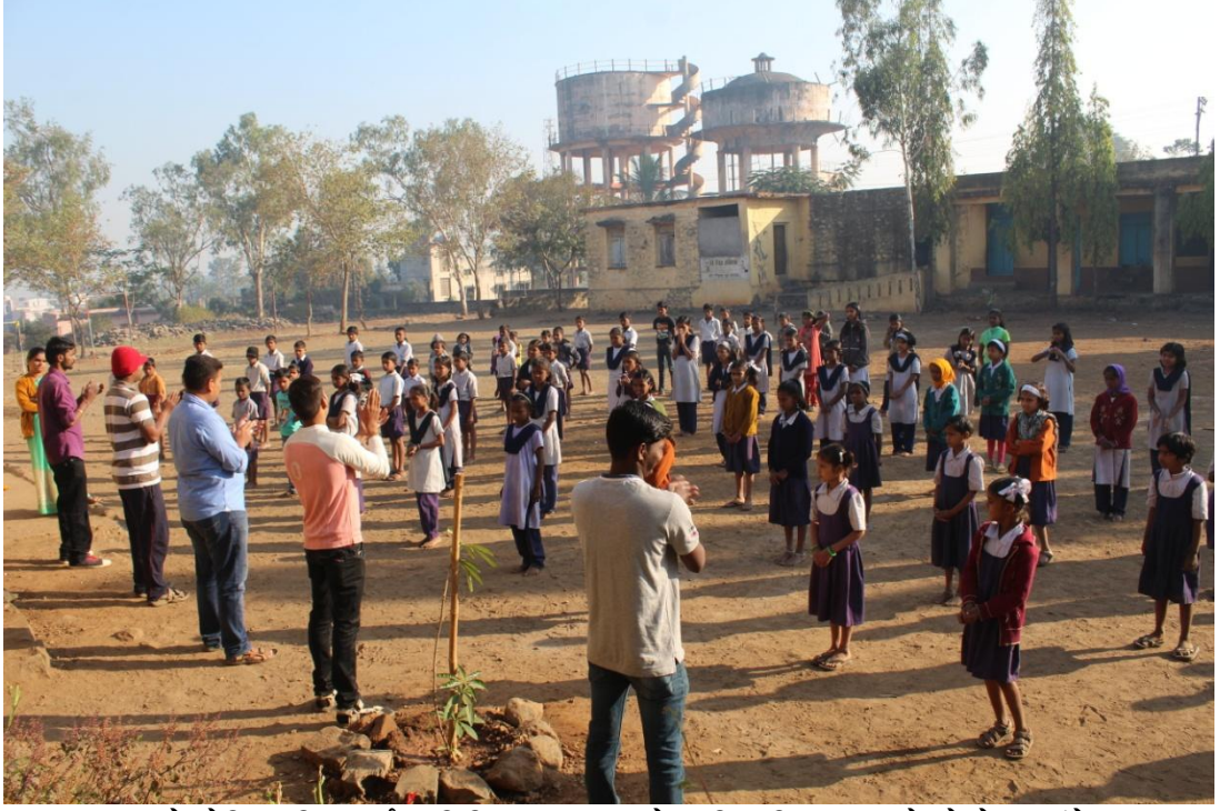
साखराळे येथिल विद्यार्थ्यांना विविध कला व खेळ शिकविताना रा.से.यो.चे स्वयंसेवक