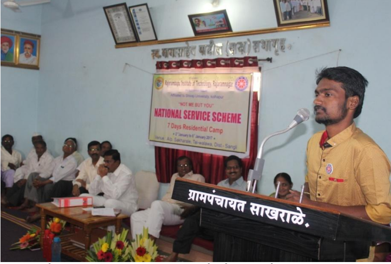
शिबीरातील आपले अनुभव कथन करताना रा.से.यो. स्वयंसेवक