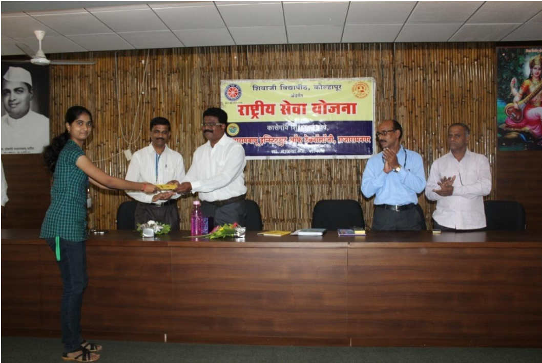
२६ जुलै २०१६ रोजी राष्ट्रीय सेवा योजना उद्घाटन व सदस्य नोंदणी समारंभाचे वेळी स्वयंसेवकांना एन.एस.एस. दैनंदिनी प्रदान करताना प्रमुख पाहुणे