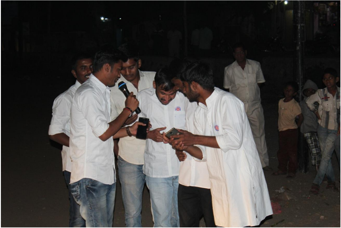
'कॅशलेस अर्थव्यवस्था' या विषयावर लघुनाटिका सादरीकरण करताना एन.एस.एस.चे स्वयंसेवक