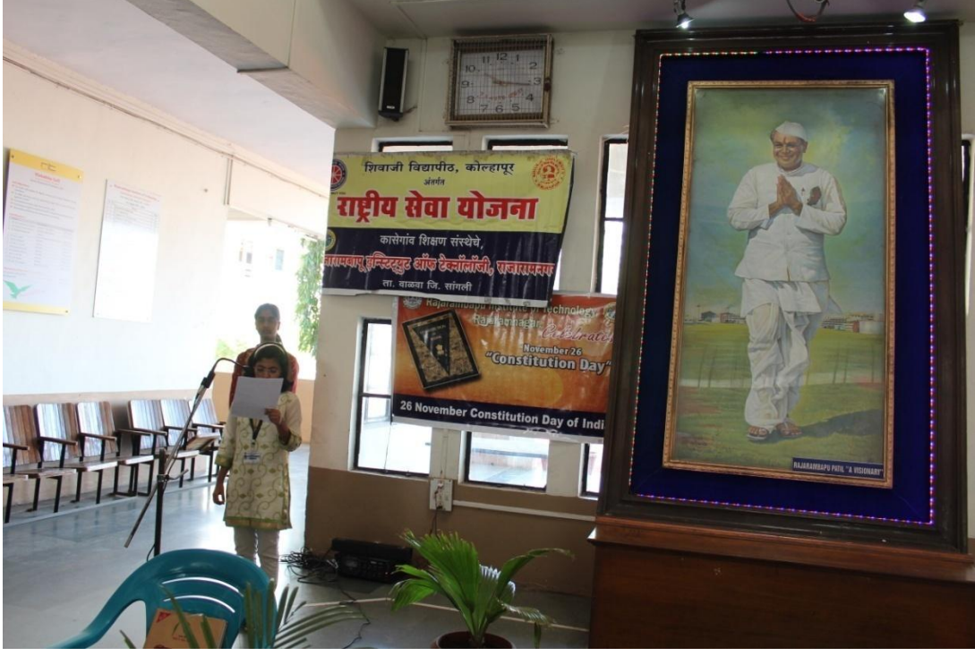
दिनांक २६ नोव्हेंबर २०१६ रोजी संविधान दिनानिमित्त “संविधानाचे वाचन”