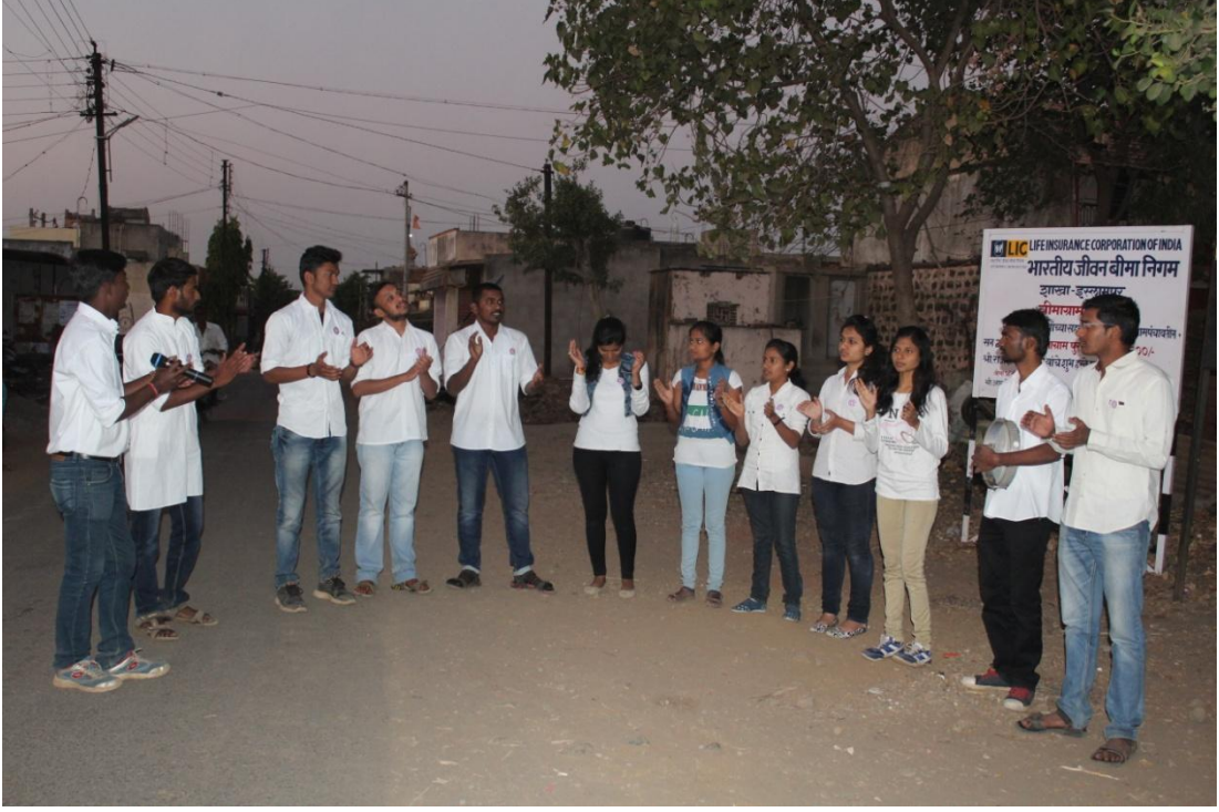
साखराळे येथे 'कॅशलेस अर्थव्यवस्था' या विषयावर लघुनाटिका सादरीकरण करताना एन.एस.एस.चे स्वयंसेवक