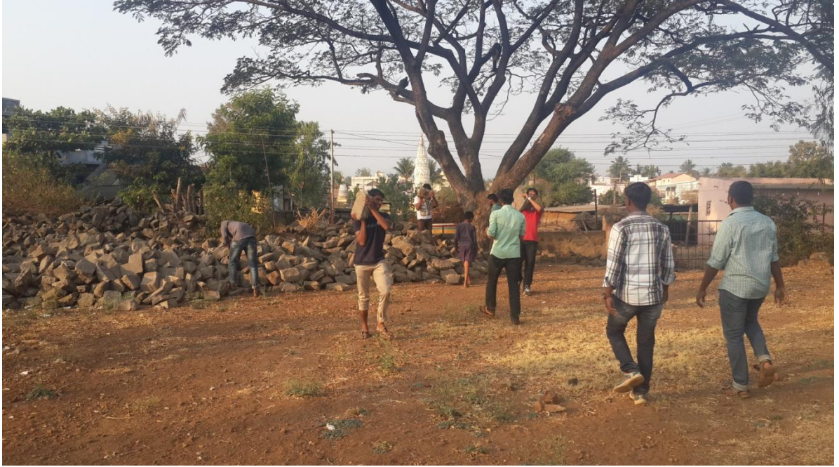
ग्रामस्वच्छता मोहिमेअंतर्गत श्रमदान करताना रा.से.योजनेचे स्वयंसेवक विद्यार्थी ठिकाण — जिल्हा परिषद शाळा परिसर, साखराळे