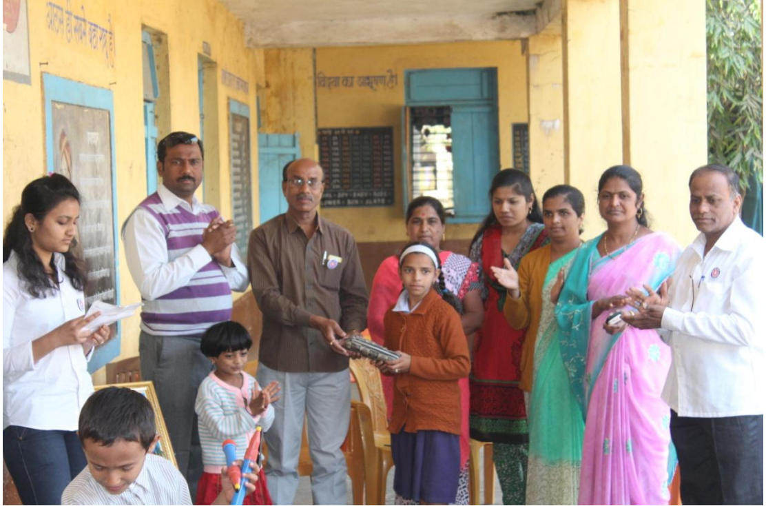
साखराळे येथिल जिल्हा परिषद शाळेमधील विद्यार्थ्यांमध्ये विविध स्पर्धा आयोजित केलेल्या त्या स्पर्धामध्ये विजयी झालेल्या विद्यार्थ्यांना बक्षिस प्रदान करताना शाळेच्या शिक्षिका, कार्यक्रम अधिकारी व एन.एस.एस.चे स्वयंसेवक