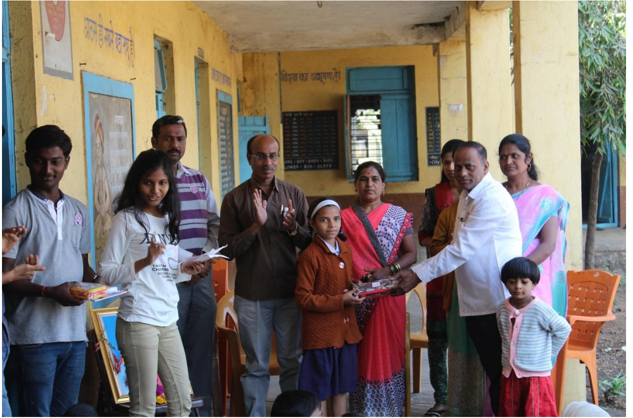
क्रांतीज्योती सावित्रीबाई फुले यांच्या जयंती निमित्त जि.प.साखराळे येथील विद्यार्थ्यांना शैक्षणिक साहित्याचे वाटप करण्यात आले