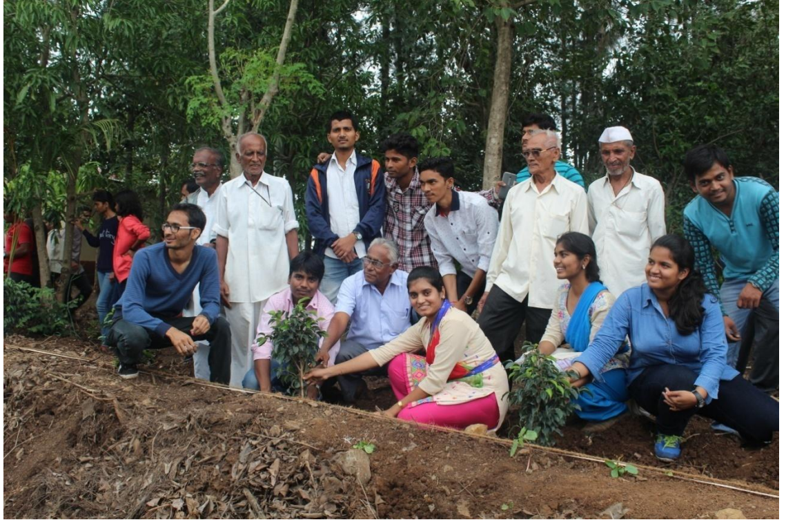
जुलै २०१६ क्रांती स्मृती वन, बलवडी येथे राष्ट्रीय सेवा योजना चे वतीने वृक्षारोपन केले