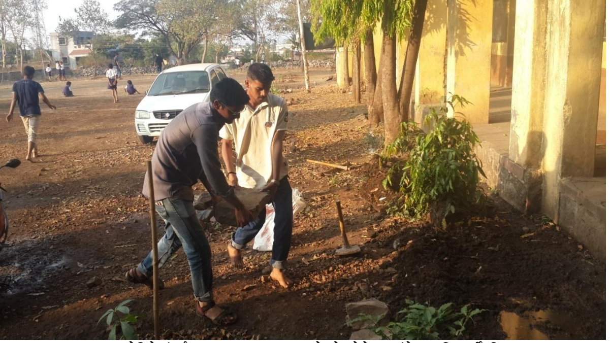
ग्रामस्वच्छता मोहिमेअंतर्गत श्रमदान करताना रा.से.योजनेचे स्वयंसेवक विद्यार्थी ठिकाण — जिल्हा परिषद शाळा परिसर, साखराळे