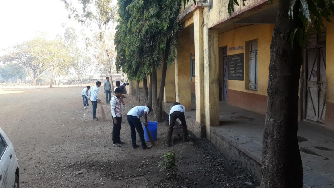
साखराळे येथील जि.प.शाळा परिसरामध्ये स्वच्छता करताना स्वयंसेवक