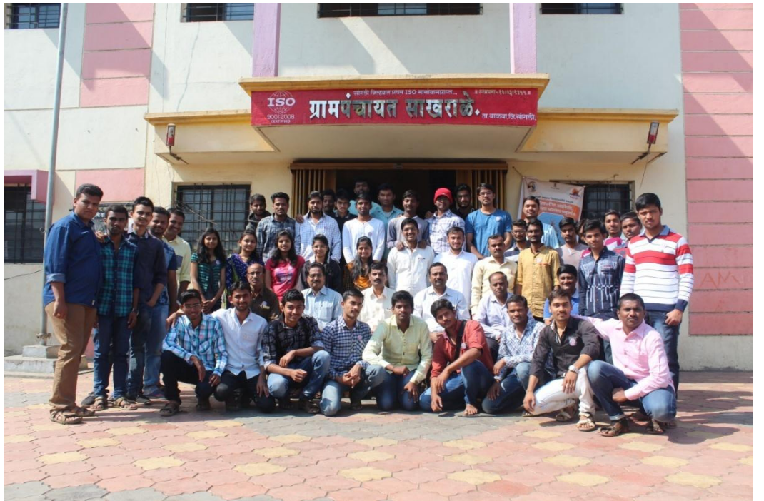
शिबीरामधील सहभागी विद्यार्थी प्रमुख मान्यवरांसमवेत