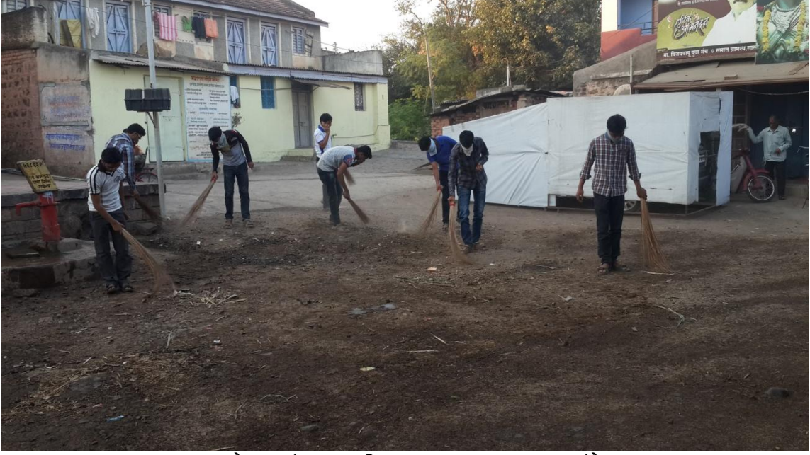
साखराळे ग्रामपंचायत परिसर स्वच्छता करताना स्वयंसेवक