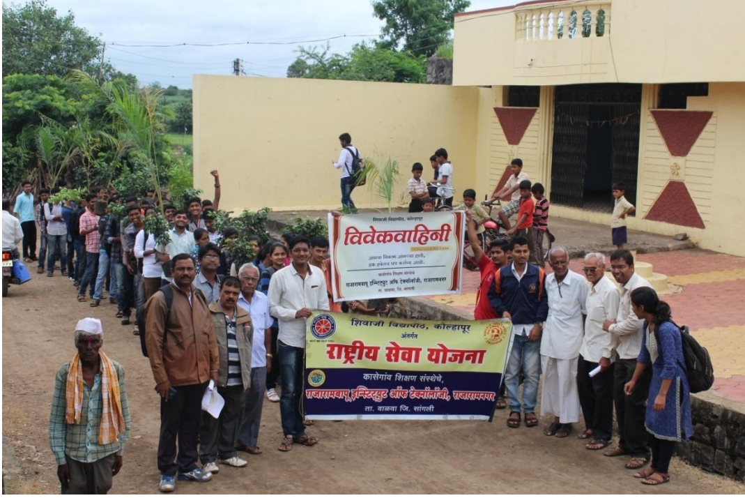
जुलै २०१६ क्रांती स्मृती वन, बलवडी येथे एक दिवसीय कार्यशाळा आयोजित केलेली त्यावेळी बलवडी येथे वृक्षदिंडी चे आयोजन